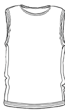
PETTORINA RACE *(MINIMO 30 PEZZI)