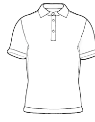
POLO CAMICIA JERSEY MC *(MINIMO 30 PEZZI)