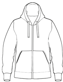
OPEN HOODIE *(MINIMO 20 PEZZI)