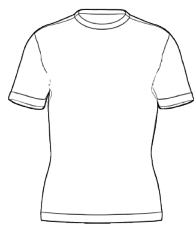
UV T-SHIRT TEAM MC *(MINIMO 30 PEZZI)