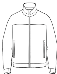
AW JACKET FLEECE *(MINIMO 20 PEZZI)