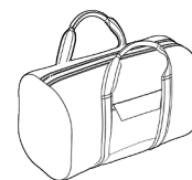
BOAT BAG *(MINIMO 500 PEZZI)