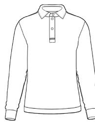
POLO CAMICIA JERSEY ML *(MINIMO 30 PEZZI)