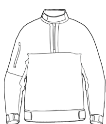
HP SPRAY TOP *(MINIMO 20 PEZZI)